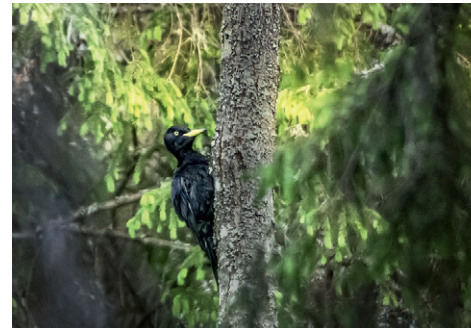
Pic Noir