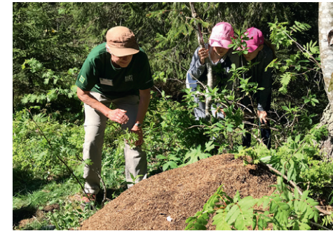
Des élèves découvrent une fourmilière au Marchairuz

Dans cette animation, les élèves approchent la fourmi sous un angle scientifique. Ils découvrent, à travers des activités ludiques, l'anatomie des fourmis, leur habitat et leur organisation sociale au sein d'une fourmilière.